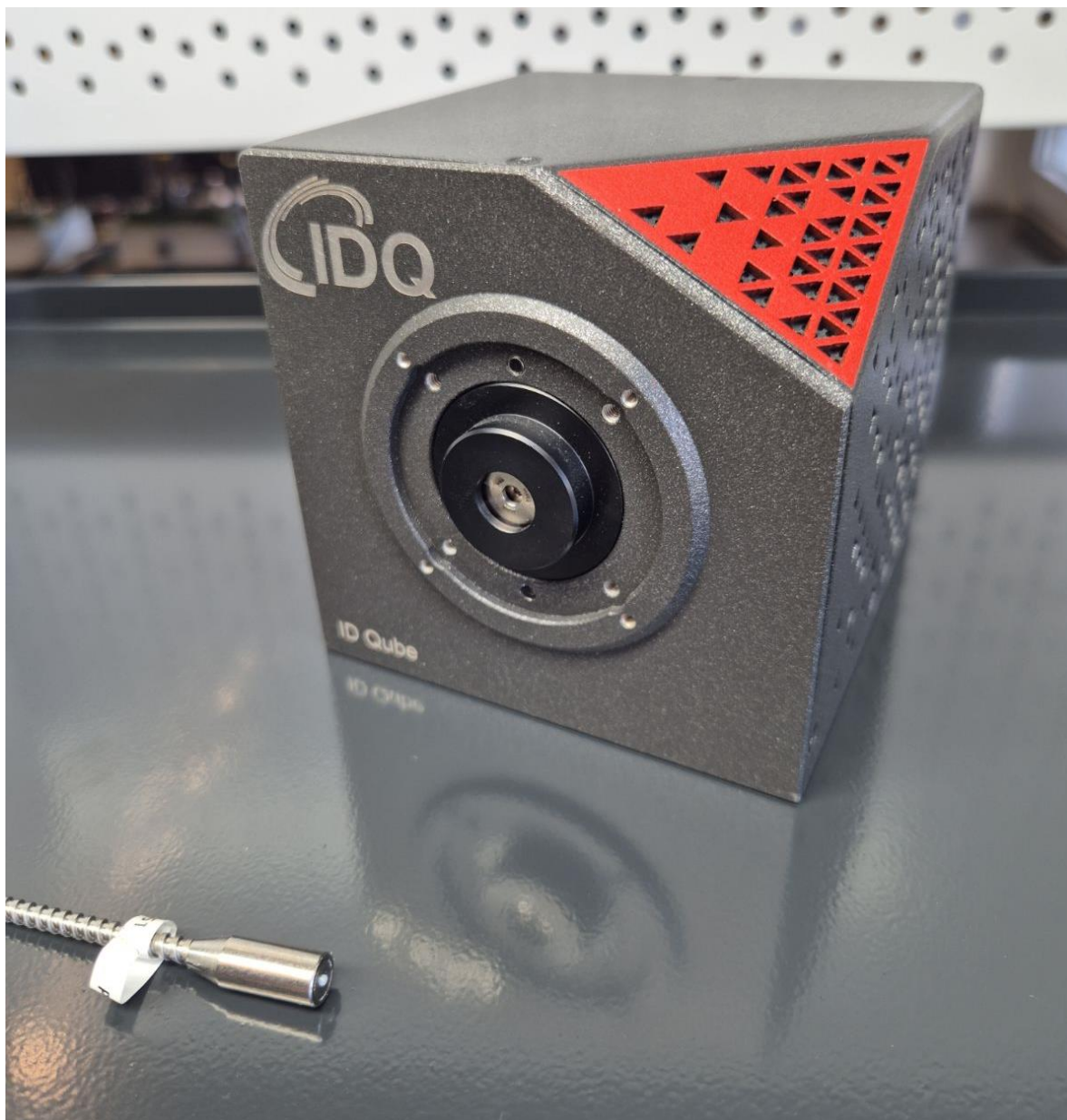
Rysunek 2 Uszkodzenie detektora 1/2