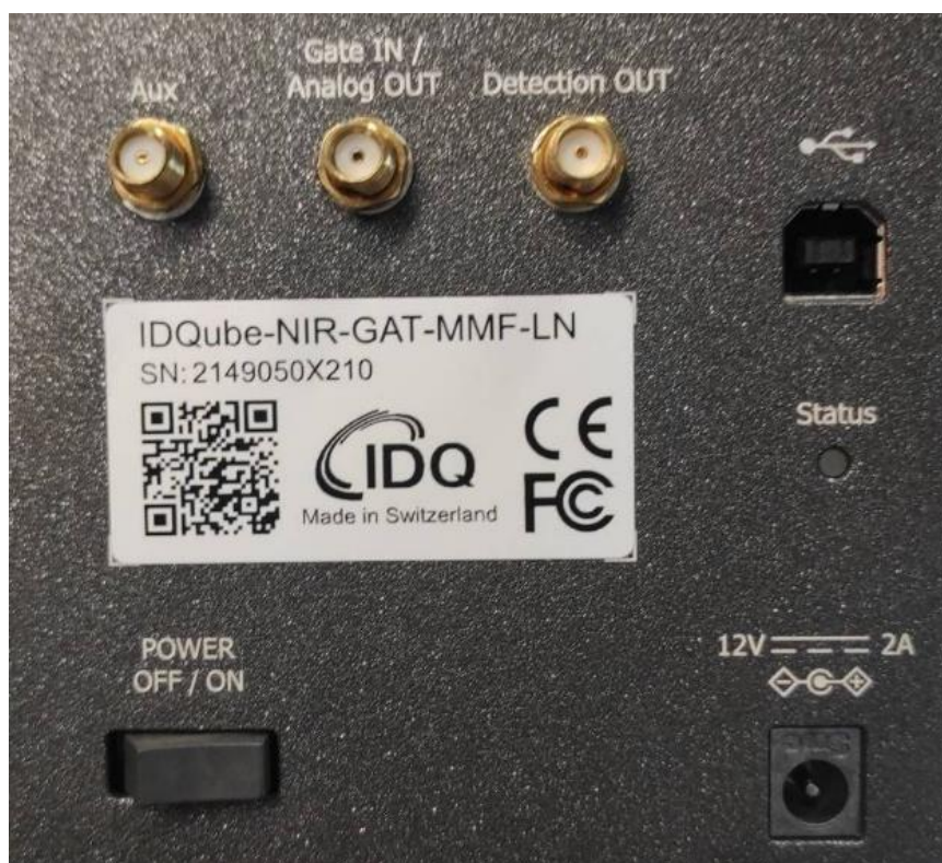
Rysunek 1 Tabliczka znamionowa detektora

Przedmiotem naprawy jest detektor pojedynczych fotonów IDQube-NIR-GAT-MMF-LN.